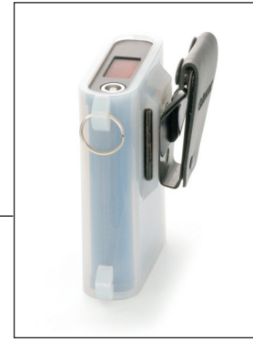
Защитный силиконовый рукав с ремнями/зажимами