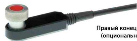
Правый конец зонда (опциональный)

При помощи множественного эха показания считываются путем измерения временной задержки между любыми тремя последовательно отраженными от задней поверхности сигналами. Время T1 (толщина покрытия) не учитывается. Время T2 и T3 равны времени прохождения сигнала через металл. Только после рассмотрения трех эхо-сигналов измерения могут автоматически подтверждены (где T2 = T3)